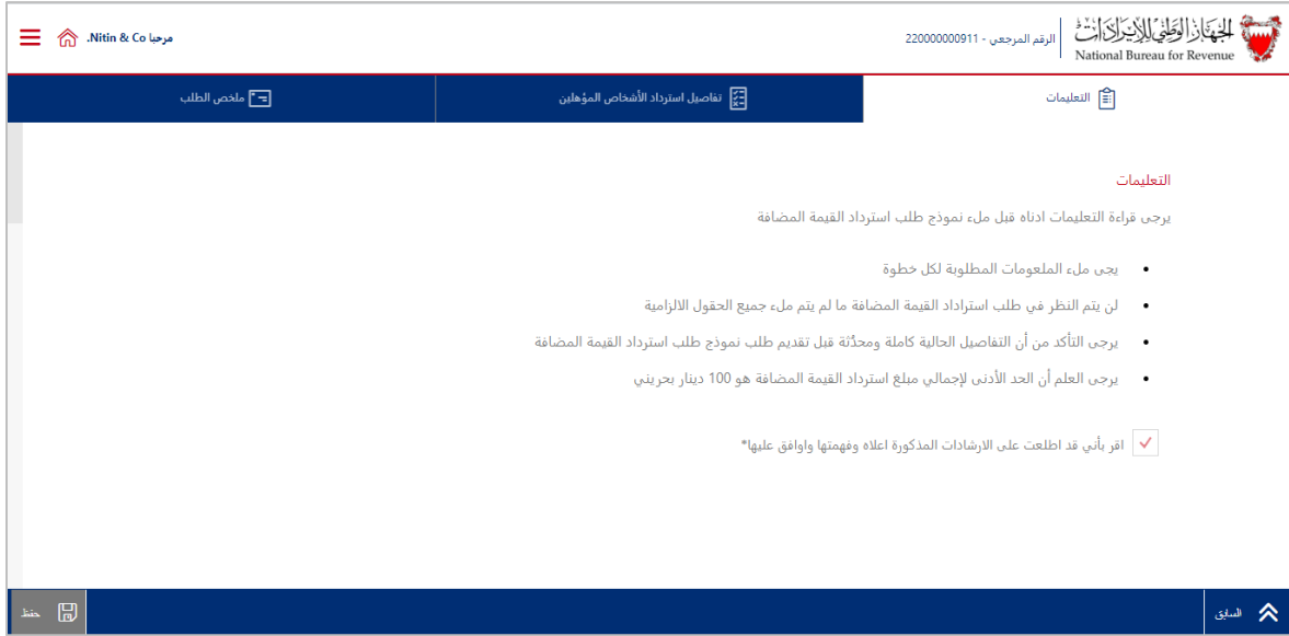
الشكل 8 صفحة التعليمات

ملاحظة: يمكن للشخص المؤهل حفظ الاستمارة بالنقر فوق زر "حفظ" في الزاوية اليمنى السفلية.