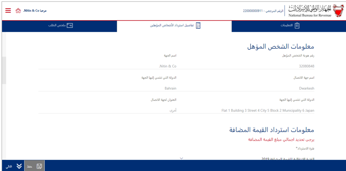
شكل 9 صفحة بيانات الشخص المؤهل

5. يتم عرض بيانات الشخص المؤهل، التي تم إدخالها سابقاً في مرحلة التسجيل.