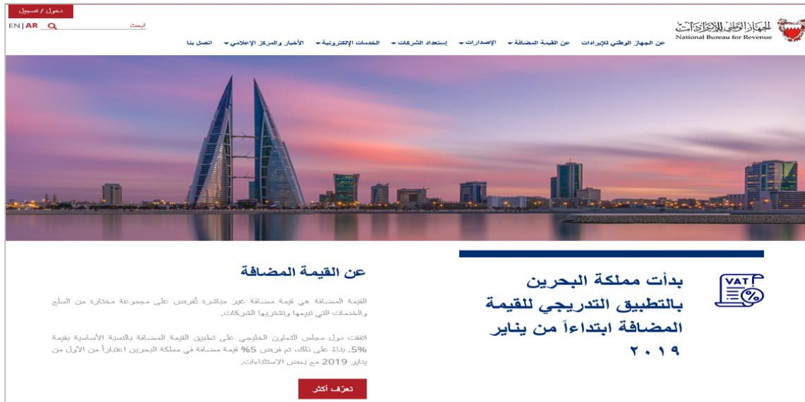
شكل 5: الصفحة الرئيسية لموقع الجهاز الوطني للإيرادات