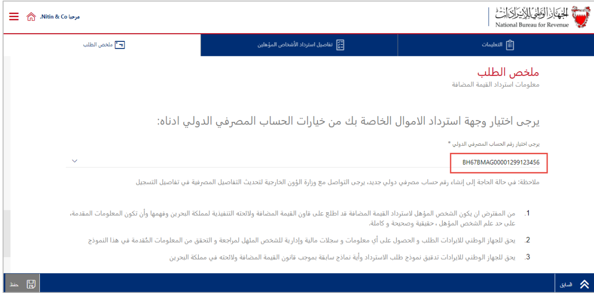
شكل 14 بيانات رقم ال IBAN

10. ضع علامة على مربع التصريح وانقر على زر تقديم الطلب.