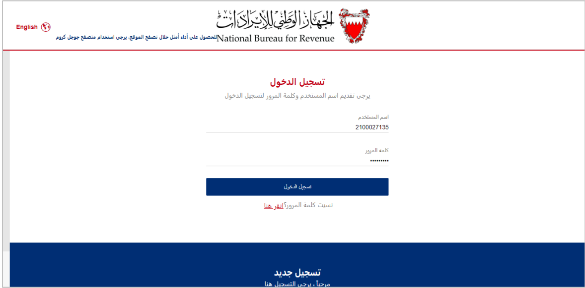
الشكل 6 صفحة الدخول لموقع الجهاز الوطني للإيرادات

2. قم بتسجيل الدخول إلى البوابة الإلكترونية باستخدام اسم المستخدم وكلمة المرور الخاصة بك (المستخدمة أثناء بيانات التسجيل).