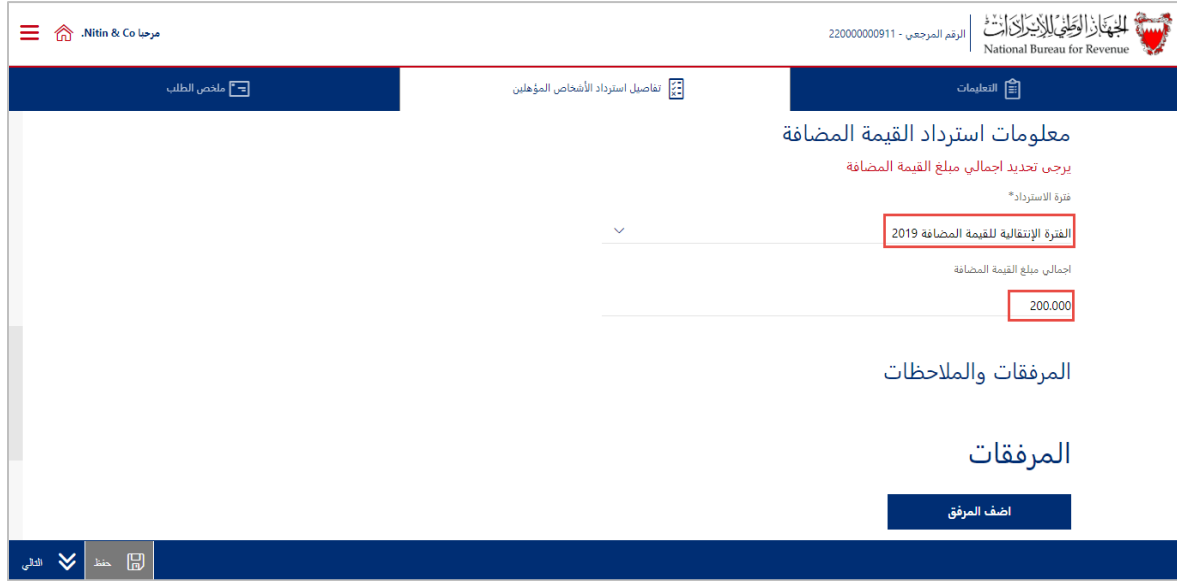
شكل 10 قسم إدخال بيانات طلب الاسترداد

يتيح قسم "المرفقات والملاحظات" للشخص المؤهل إرسال معلومات مكتملة) مثل الفواتير ومعلومات الدفع (إلى الجهاز الوطني للإيرادات.