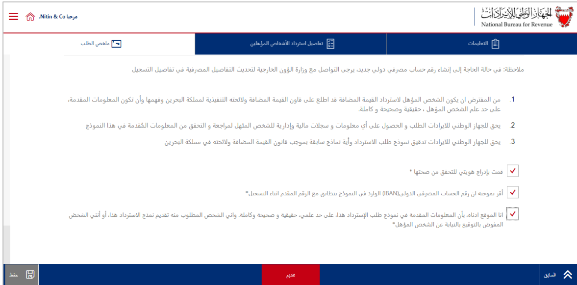
الشكل 15 مربعات البيانات وتقديم طلب استرداد

10. ضع علامة على مربع التصريح وانقر على زر تقديم الطلب.