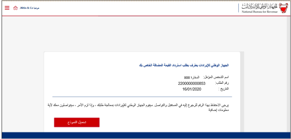
الشكل 16 صفحة التأكيد

12. سوف يقوم كل من وزارة الخارجية والجهة الوطني للإيرادات بمراجعة طلبات استرداد الأشخاص المؤهلين. بعد المراجعة، يمكن حدوث إحدى الحالات التالية: